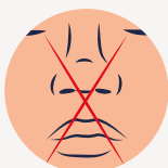
Perte du goût et de l'odorat