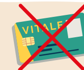
je n'ai pas de carte vitale