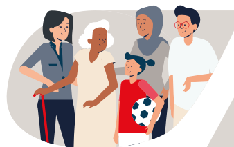
le vaccin est pour tout le monde