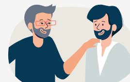
une personne de confiance