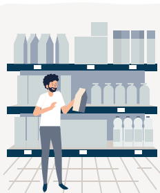
dans les magasins