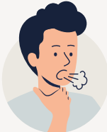
Difficulté à respirer