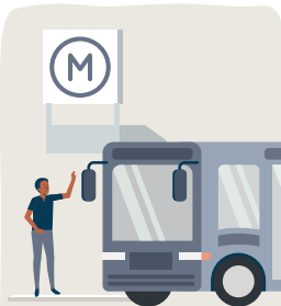
dans les transports

C'est un document nécessaire pour accéder à certains lieux ou événements