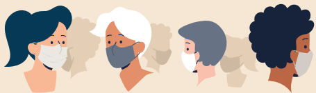
il y a du monde