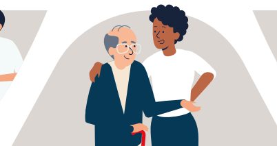
le vaccin n'est pas obligatoire mais il me protège, et protège les autres