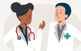
un docteur ou un pharmacien

À tout moment, je peux me faire aider par :