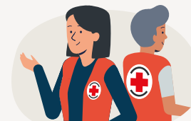
la Croix-Rouge française