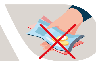
le vaccin est gratuit